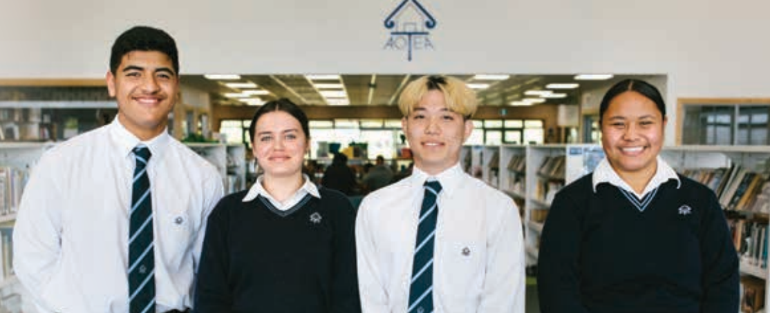
Mei tēta'i 150,000 tamariki 'āpi'i tua-rua e 'āpi'i nei kia rauka 'ia rātou te peapa 'āpi'i tua-rua teitei NCEA.